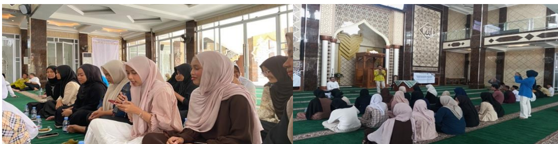
Gambar 3. Suasana Pelatihan Storytelling.

Pelatihan storytelling dilaksanakan kepada 37 anggota Remaja Masjid IKRAM di Masjid Al Muhajirin Jelupang, Tangerang Selatan. Kegiatan diawali dengan pemaparan konsep personal branding sebagai “Label Diri” yang merujuk pada McNally dan Speak (2023), bahwa identitas individu dibangun melalui konsistensi nilai dan narasi yang dikomunikasikan secara strategis. Contoh sederhana seperti penyebutan merek “Aqua” untuk air mineral digunakan untuk membantu peserta memahami bagaimana sebuah label dapat melekat kuat melalui konsistensi komunikasi.