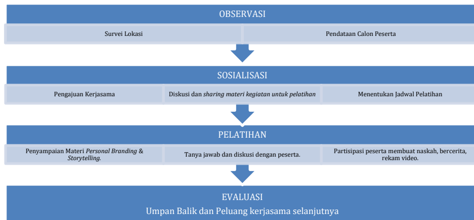
Gambar 2. Langkah-Langkah Kegiatan PkM