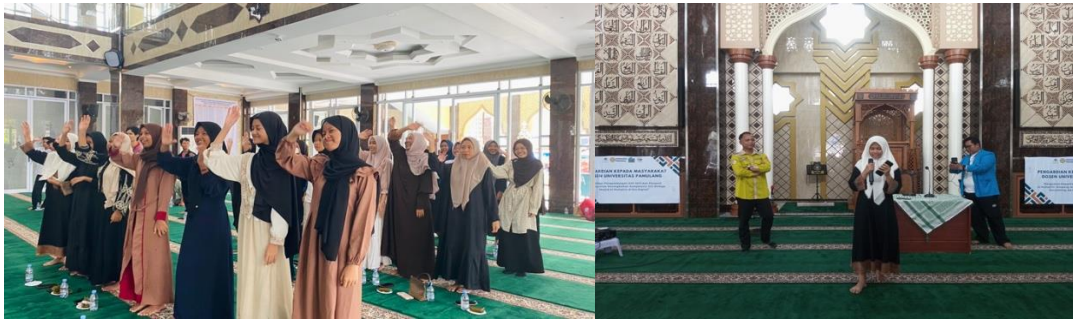
Gambar 4. Kegiatan Pelatihan Storytelling Remaja Masjid

Fenomena ini memperlihatkan bahwa peserta lebih terbiasa mereproduksi konten visual dibandingkan membangun narasi orisinal. Ketergantungan pada template video viral menunjukkan kecenderungan komunikasi yang imitasi dan kurang reflektif.