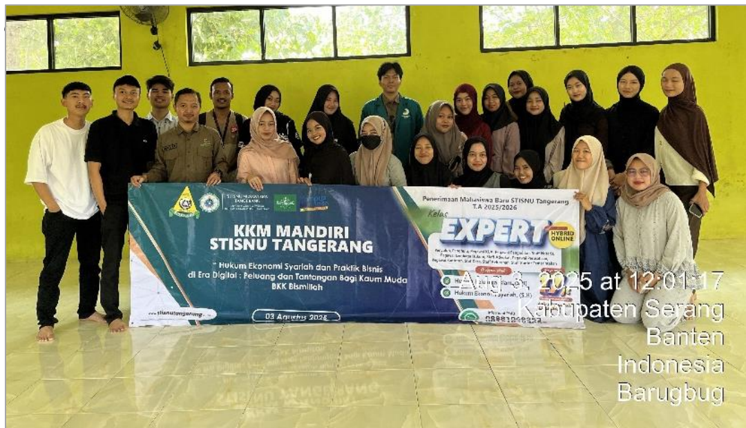
Gambar 3 – Dokumentasi Kegiatan Seminar bersama Peserta.