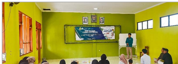
Gambar 2. Pemberian materi Hukum Ekonomi Syariah dan Bisnis di Era Digital.

Kegiatan seminar mendapatkan respons yang positif dan interaktif dari kaum muda BKK BISMILLAH. Meskipun mereka masih berada dalam tahap awal dalam menerima pemahaman mengenai hukum ekonomi syariah, mereka menunjukkan minat yang besar untuk belajar dan beradaptasi. Hal ini terlihat jelas dari antusiasme peserta dalam sesi tanya jawab serta keterlibatan mereka dalam sharing session pengalaman bisnis digital yang telah dijalankan.