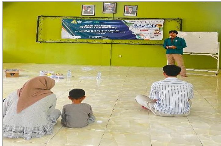
Gambar 3. Interaksi Peserta.

Tanggapan peserta cukup interaktif, meskipun pola pertanyaannya masih berada dalam koridor pertanyaan dasar terkait validitas akad dalam platform digital. Hal ini mengindikasikan bahwa materi yang disampaikan adalah hal baru bagi sebagian besar dari mereka, sehingga pemahaman mereka masih perlu didalami. Hasil ini memberikan masukan penting untuk program berkelanjutan. Meskipun kesadaran telah meningkat, kebutuhan untuk kegiatan lanjutan (seperti workshop praktik penyusunan akad atau sesi mentoring individual ) untuk pendalaman materi menjadi krusial.