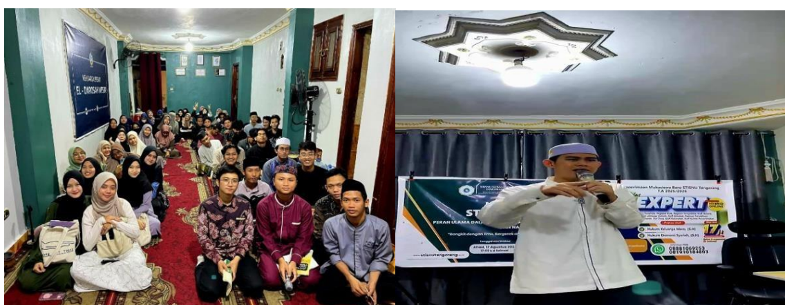
Gambar 1. Peserta seminar kebangsaan

Implementasi program ini tidak hanya berhasil mentransfer pengetahuan ( transfer of knowledge ), tetapi lebih penting lagi telah melakukan transformasi nilai ( transfer of value ) dan pembangkitan kesadaran kritis ( critical awareness ) peserta mengenal jati diri dan tanggung jawabnya sebagai intelektual muda Indonesia di Mesir.