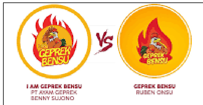
Gambar 4. Contoh kasus sengketa merk dagang

untuk mengembangkan usaha, terlebih yang berasal dari hobi. Oleh karena itu, prinsip hukum Islam seyogyanya harus selalu dijadikan pedoman dalam berwirausaha karena prinsip hukum syariah akan selalu melindungi hak kepemilikan yang sah dan mendorong semua masyarakat yang ingin memulai usaha agar dapat berwirausaha dengan itikad baik dan jujur. Di sisi lain, 22,7% responden memang memilih legalitas sebuah usaha kecil masih belum terlalu penting dipertimbangkan untuk perjalanan pembangunan usaha dari hobi. Kemungkinan yang pasti dari persentase tersebut karena skala usaha yang dijalani kemungkinan masih kecil dan belum dijadikan bisnis atau mata pencaharian utama.